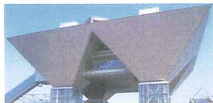
東京ビッグサイト